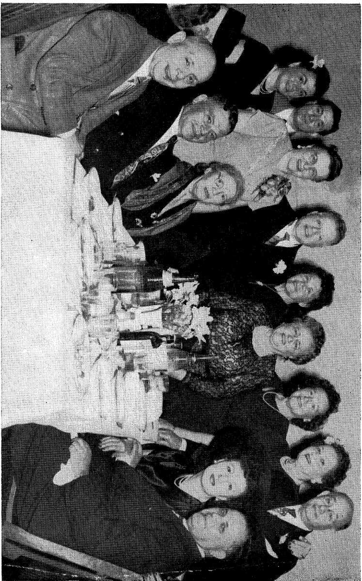
אך מיט מיין פרוי, ברילדער און שוועסטער, שוועגערין און שוועגער אריף אַ צוזאַמענקום פאַר מיין אַפּפּאַר אום ציוניסטישן קאָנגרעס, 1946